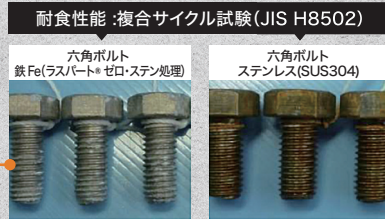
耐食性能: 複合サイクル試験(JIS H8502) 六角ボルト 鉄Fe(ラスパート®ゼロ・ステン処理) / 六角ボルト ステンレス(SUS304) 試験100サイクル経過写真